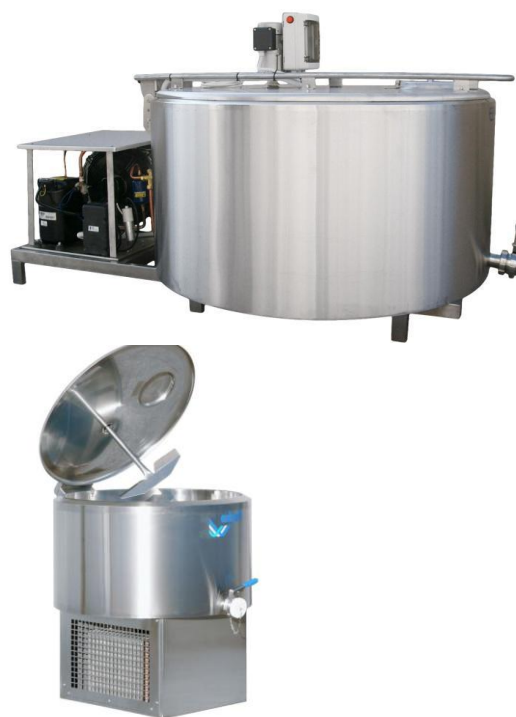
Холодильный танк ROM/DX PAKCO (Бельгия)